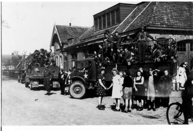
Canadezen in Zuidwolde

8 De route die u nu fiets richting Zuidwolde is het zelfde als Canadezen volgden in 1945