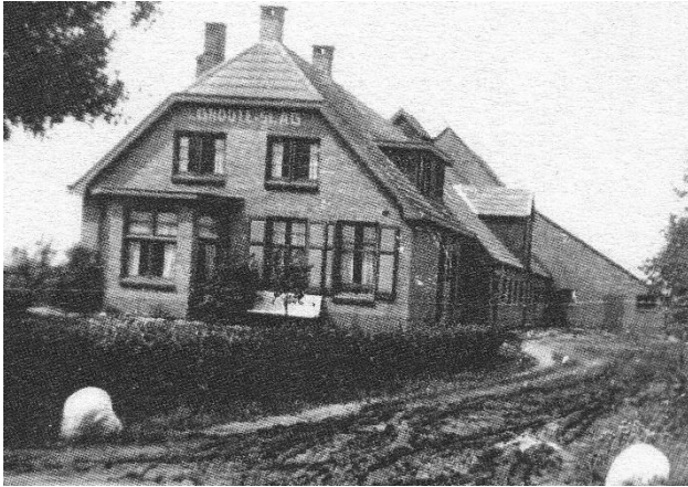
Boerderij van de fam. Andringa voor de brand

9 In de oorlog woonde hier de Fam. Andringa , deze boerderij werd in de oorlog bij de bevrijding op 7 april 1945 in brand geschoten , in de boerderij zaten 15 militairen , drie Duitse soldaten kwamen om tijdens een vuurgevecht met Canadezen