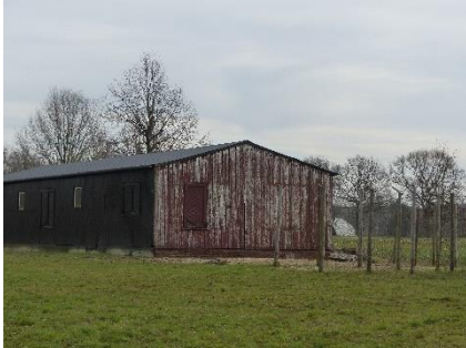
Barak bij de Wemme

Voordat we aan onze fietsroute gaan beginnen brengen we een bezoek aan de barak bij het parkeerterrein van de Wemme aan de Burg.meester Tonckensstraat