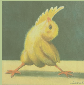
Anneke Schepers | Olieverf