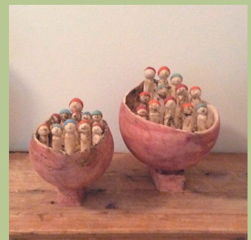
Emmy Fieten | Keramiek