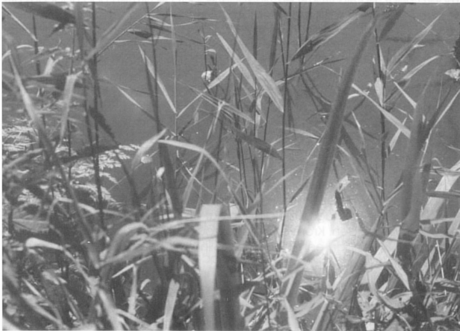
De diamant in 2004.

van de vermoorde sultan kon geen zegen rusten. Maar het bakstenen huis van Maarten Maartens werd het begin van Ruinerwold en het meer in de buurt van Ruinerwold heet vanaf die tijd het Sultansmeer.